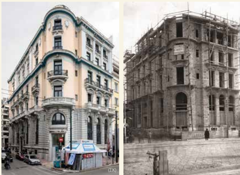
Μέγαρο Βάτη