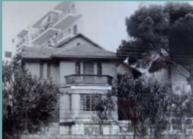
Οικία Β. Αργυρόπουλου, κατεδαφισμένη.