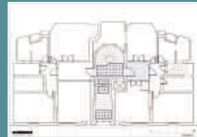
Κάτωψη κτηρίου Ζαλοκώστα 7, Φ. Μπέλλιου, Φ. Κανελλοπούλου