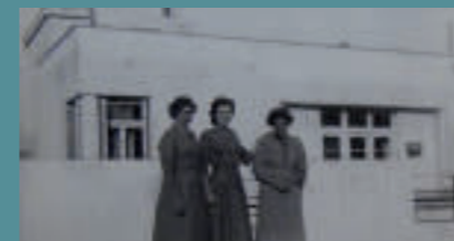
Κτήριο στην οδό Ζαμπελίου, δεκαετία 1950.