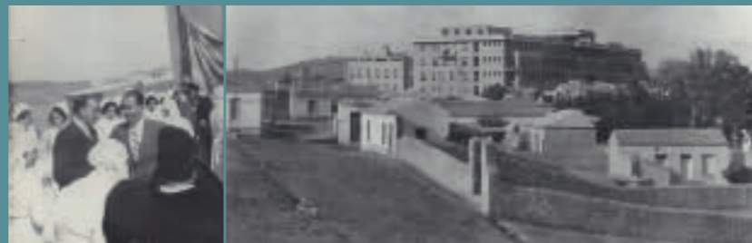
Ερυθρός Σταυρός, εγκαίνια, δεκαετία 1930.