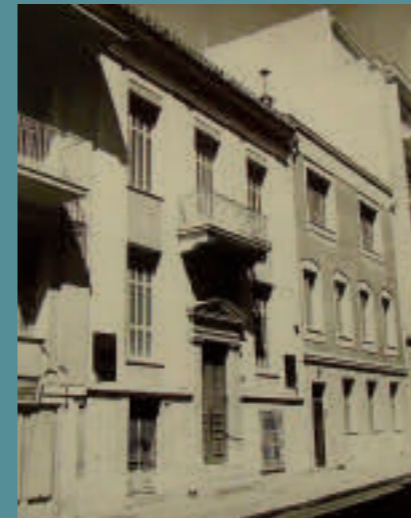
Οικία στην οδό Αναγνωστοπούλου 15, κατεδαφισμένη.